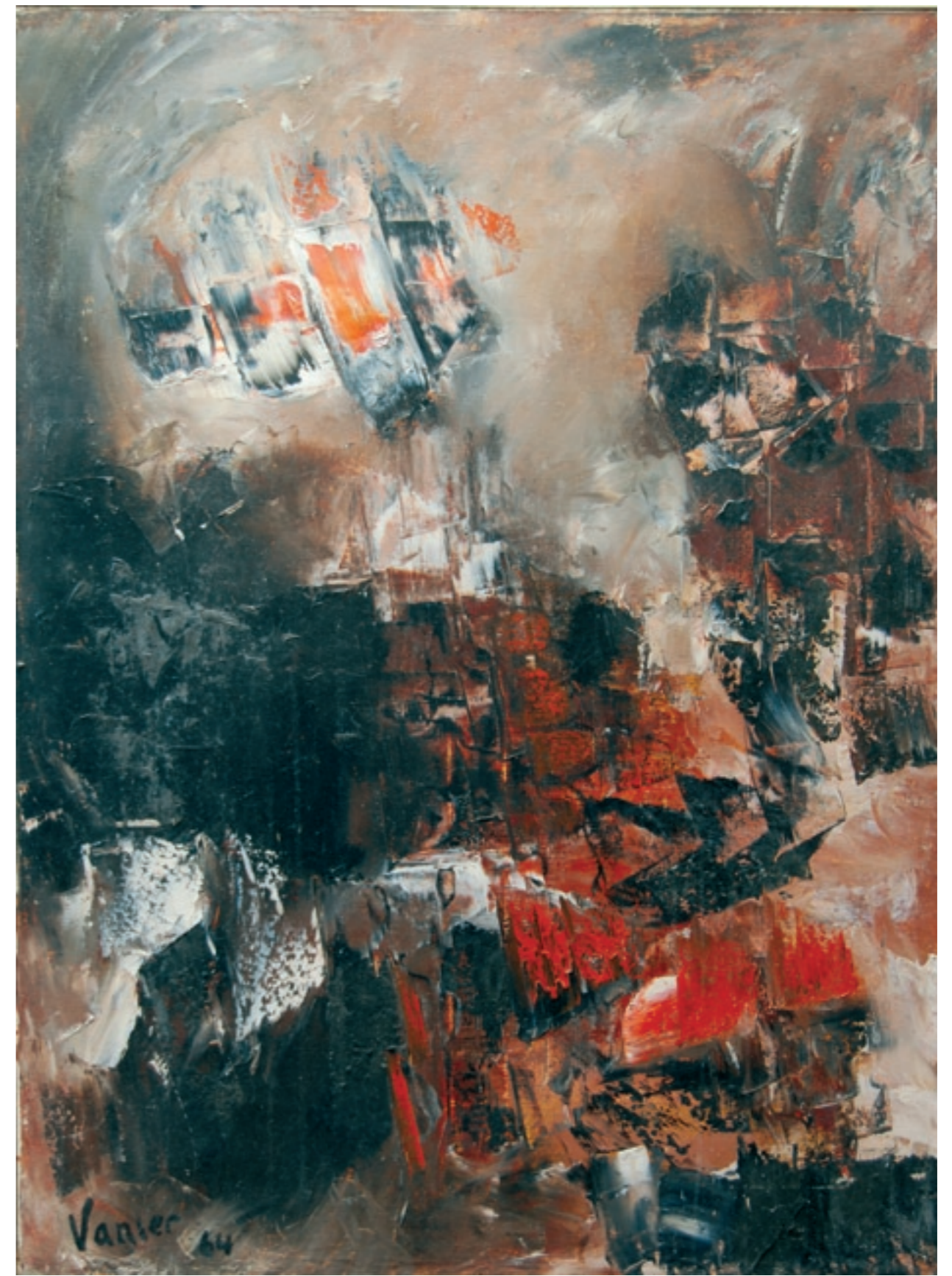
Brule pour point / huile sur toile, 100 x 73 cm - 1970