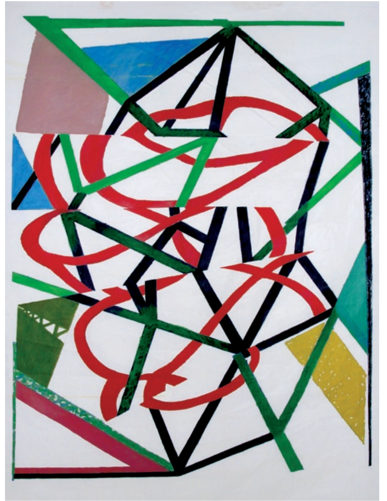
Crystal #090820 / huile sur toile, 200 x 150 cm - 2011