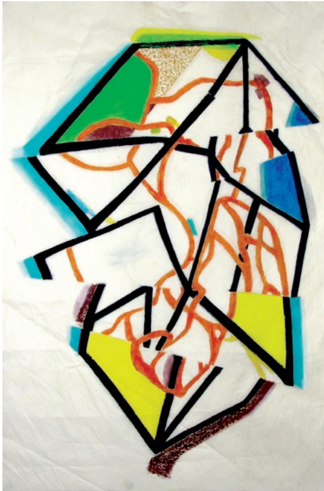
Crystal #090306 / huile sur toile, 86 x 60 cm - 2010

Musée Nat. d'art modern, Paris. Centre Georges Pompidou, Paris. Fondation Cartier, Paris. Musée de Toulon. Fond National AC, Paris. FRAC Champagne-Ardenne, Reims. FRAC Nord-Pas-de-Calais, Dunkerque. FRAC Picardie, Amiens. Musée des Beaux-Arts, Montréal. Musée Nat. des Beaux-arts, Québec. Galerie Nat. du Canada, Ottawa. Musée Ziem, Martigues. Musée Dept. d'Art Contemporain, Rochechouart. Musée d'Art Contemporain, Montréal. Rose Art Museum, Brandeis U. Waltham, Mass. USA Musée de Joliette, Québec. Art Gallery of Ontario, Toronto. Musée du Bas -St-Laurent, Rimouski, Qué. Musée de Lachine, Montréal. Galerie L & B Ellen, Concordia University, Montréal. Banque d'œuvres d'art, Ottawa.