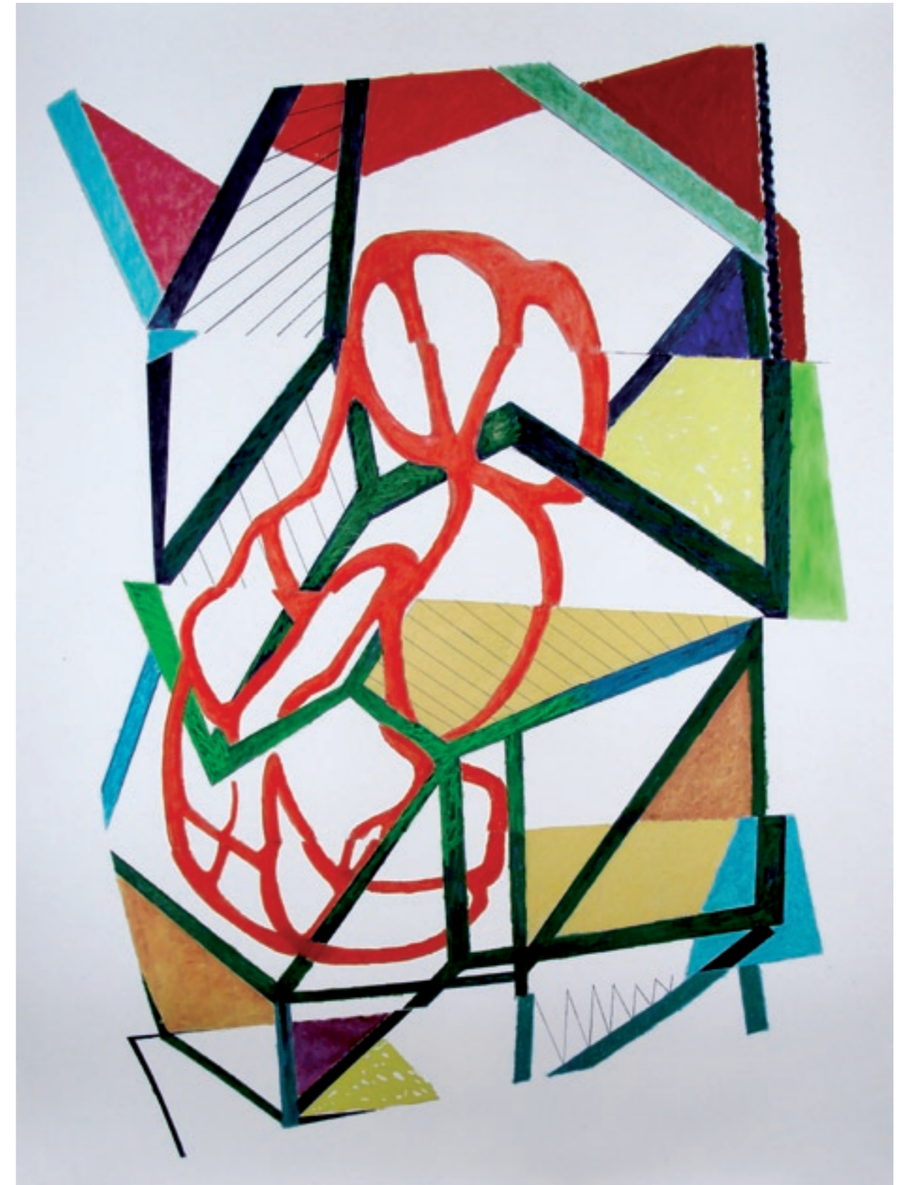
Crystal #090818 / huile sur papier 200grs 200 x 150 cm - 2010