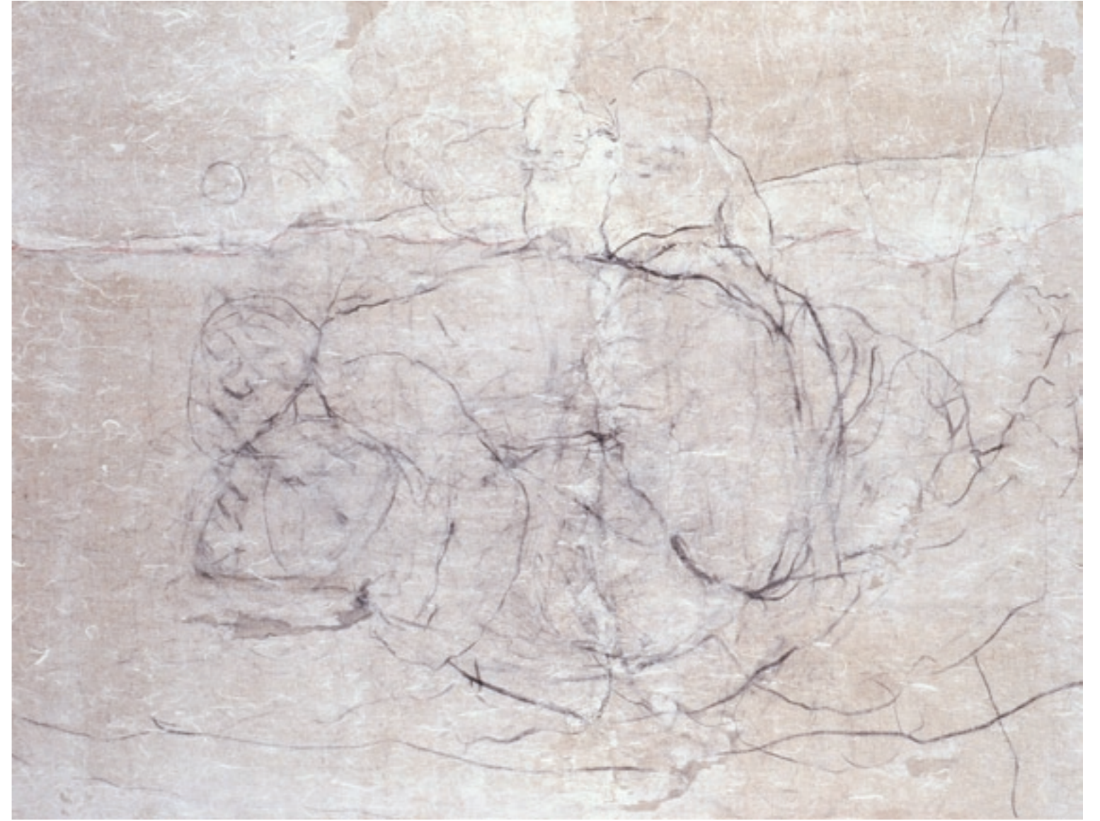
Ceux qui voyagent / fusain sur papier maroufflé sur toile, 89 x 116 cm - 2002