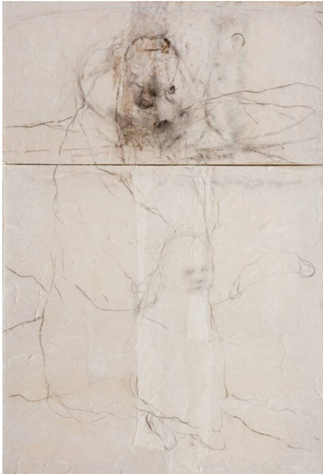
Le vieil homme et l'enfant / fusain sur papier maroufflé sur toile, 120 x 80 cm - 2005

2010 - Musée de l'Ecole des Beaux-Arts de Xi'an, Xi'an, Chine Galerie Yishu 8, Beijing, Chine 2009 - Maison de la Culture Marie-Uguay, Montréal, Canada 2008 - Zero Field Art Center, 798 Art Zone, Beijing, Chine Galerie Refined Nest, Shanghai, Chine Maison Internationale des Poètes et des Ecrivains, St-Malo, France Cathédrale de Rouen, Rouen, France Musée d'Art de Guangdong, Guangzhou, Chine Eglise Saint-Pierre aux Nonnains, Metz, France Cathédrale de Meaux, Meaux, France 2003 - Retable dans la Chapelle Notre Dame de la Sagesse, Paris, France Basilique Saint-Urbain, Troyes, France 2002 - Galerie Contrast, Bruxelles, Belgique