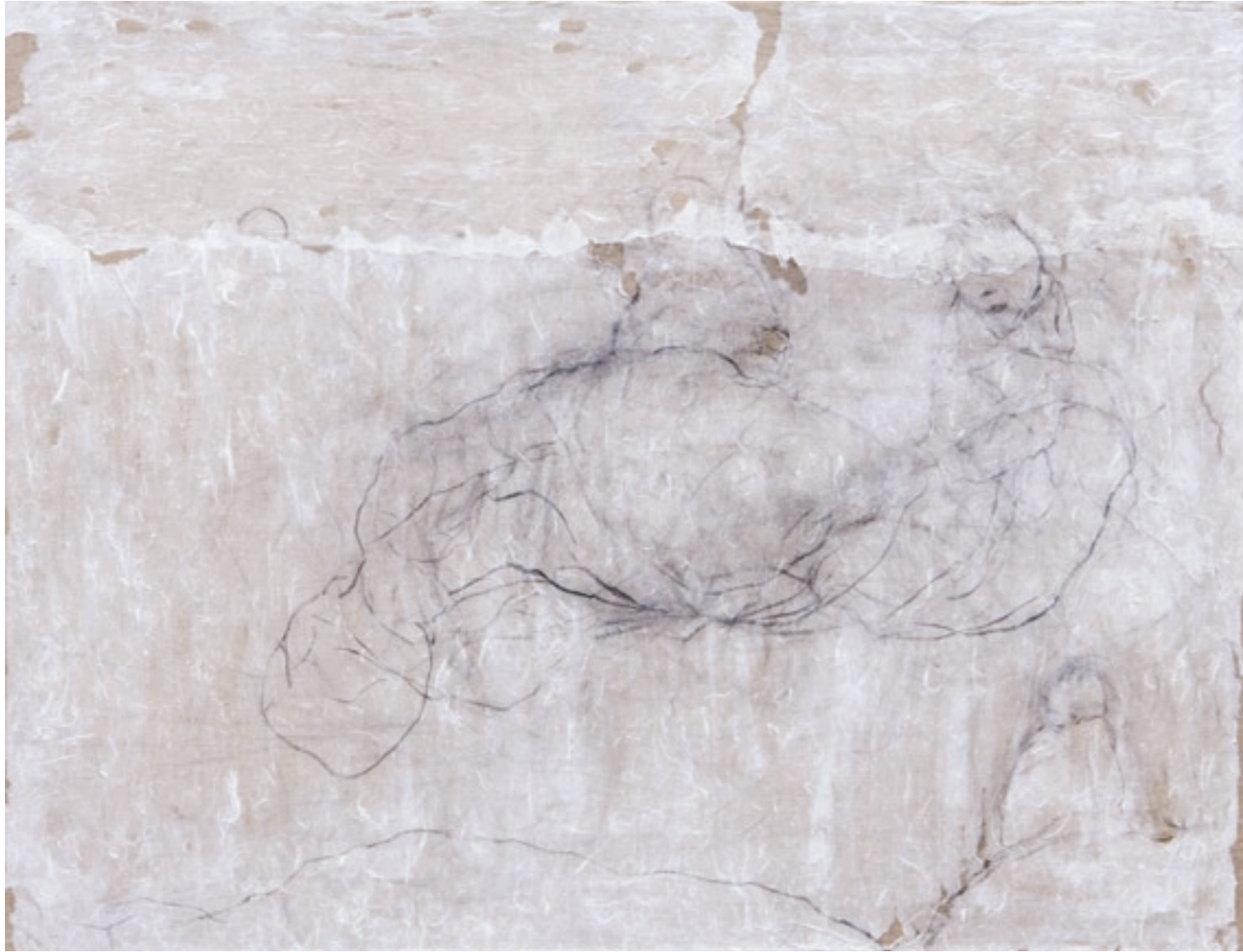
Ils voyagent sur le vent / fusain sur papier maroufflé sur toile, 89 x 116 cm - 2002